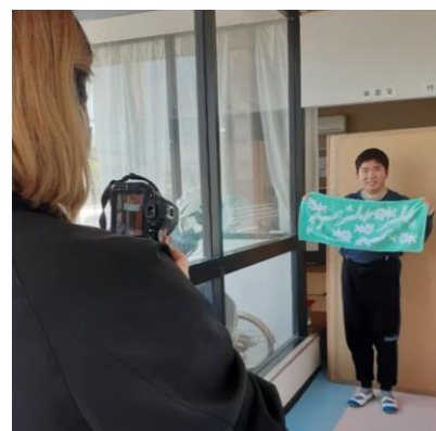
▲カタログの写真撮影～♪

通所施設「葦の家」と「えーる油山」で毎年夏と冬に授産品カタログを作成し、商品の売り上げを仲間の工賃にしています。今年もえーるは今治タオルを販売。仲間の絵をデザインしたごきげんな新色で登場です。販売に向けて、梱包も頑張っています。カタログがご入り用の方は、お気軽にご連絡ください！注文も待っています。