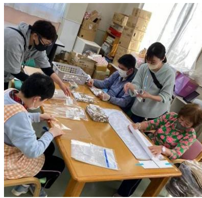
▲販売タオルを梱包しています