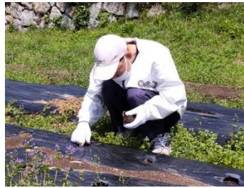
里芋を植え付け中