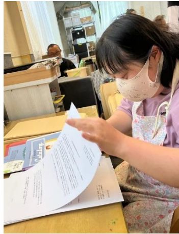
▲カタログに申込用紙をはさみます