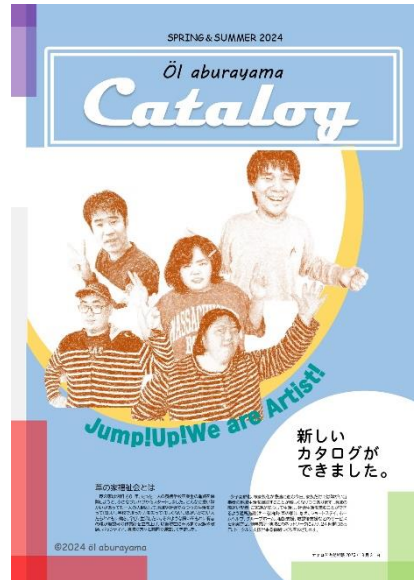
▲カタログご入り用のかたはお声かけ下さい

今年も春夏の授産品カタログによる販売が始まりました。恒例の今治タオルは干支のデザインの新色です。また、新商品はリクエストの多かった「一筆箋」です。梱包作業なども日々がんばって注文に備えています。